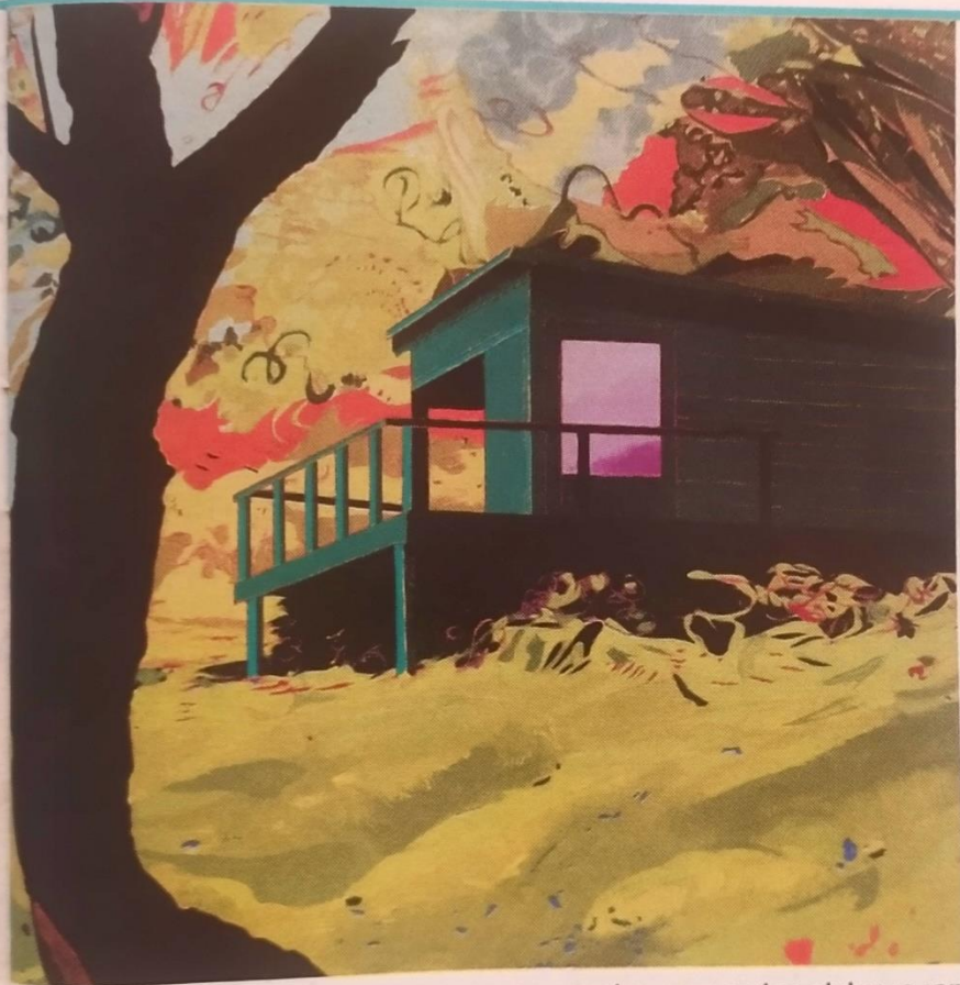
מתן בן טולילה בגלריה מאיה, תל אביב