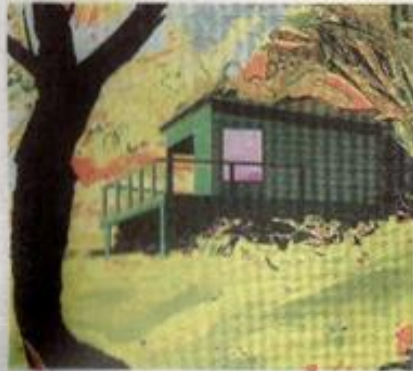
מתן בן טולילה, "חלון" (פרט), 2022

גלריה מאיה שביל המרץ 2 "120 אצבעות" תערוכה של מתן בן טולילה 15.4-23.3