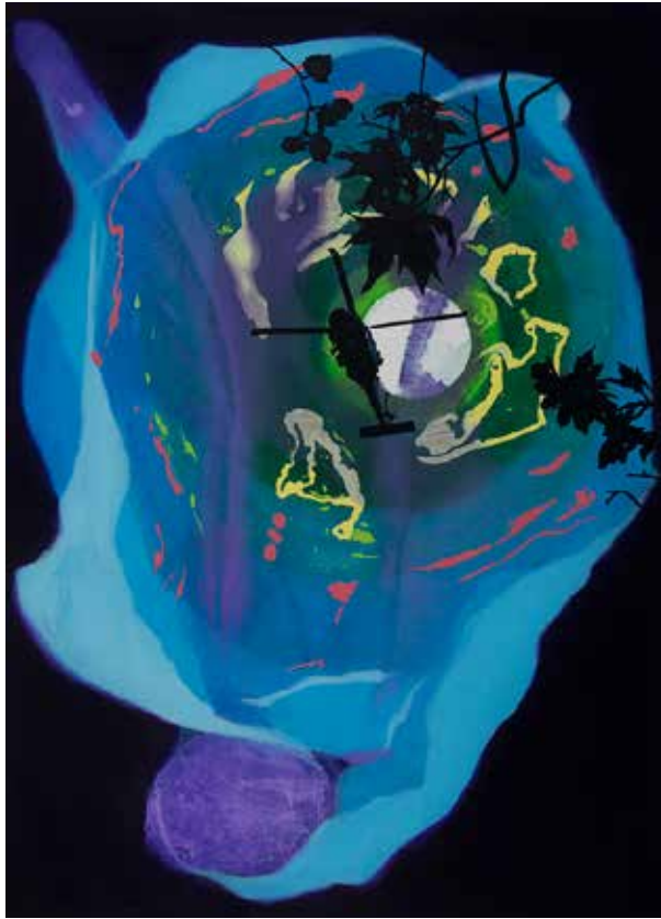
הביקור, 2019, שמן על בד, 165/120 ס"מ

גלריה מרכז ההנצחה לאמנות ישראלית, רח' המגדל, קרית טבעון | 04-9835506 שעות הפתיחה: ימים א', ב', ג', ה' 10:00-19:00 | יום ו' 9:00-12:00 | שבת 11:00-13:00 art gallery at the memorial center tivon, hamigdal st. kiryat tivon | tel 04-9835506 opening hours: sun, tue, thurs 10:00-19:00 | mon 10:00-16:00 | fri 9:00-12:00 | sat 11:00-13:00 www.tivon-lib.co.il | office@tivon-lib.co.il