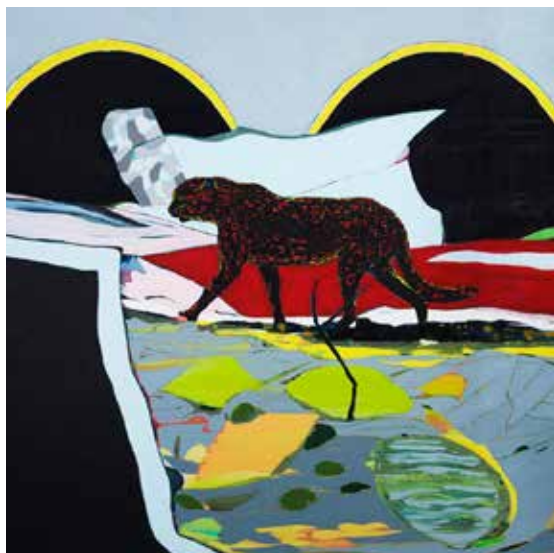
מנהרות, 2020, שמן על בד, 180/140 ס"מ