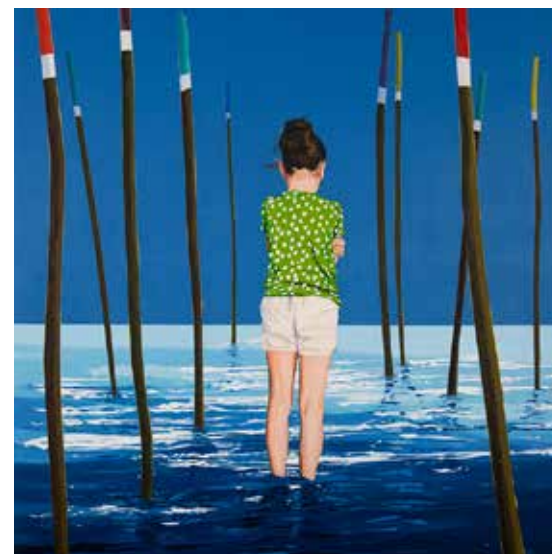
נעמי (עם הגב לירושלים), 2023, שמן על בד, 170/140 ס"מ