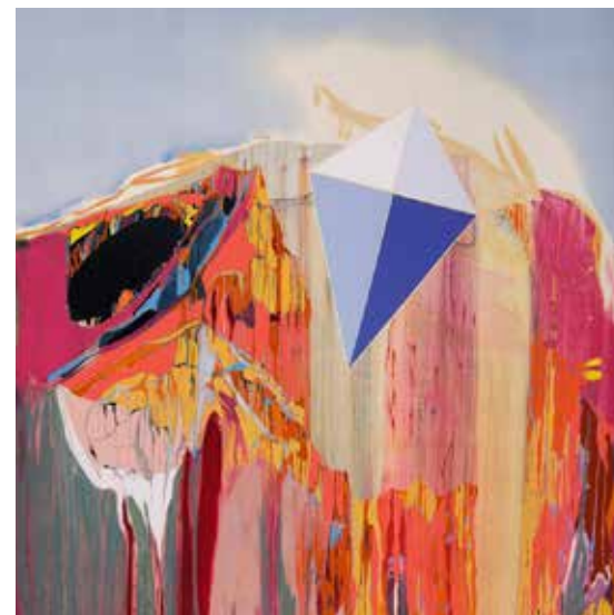
עפיפון, 2017, שמן על בד, 200/140 ס"מ