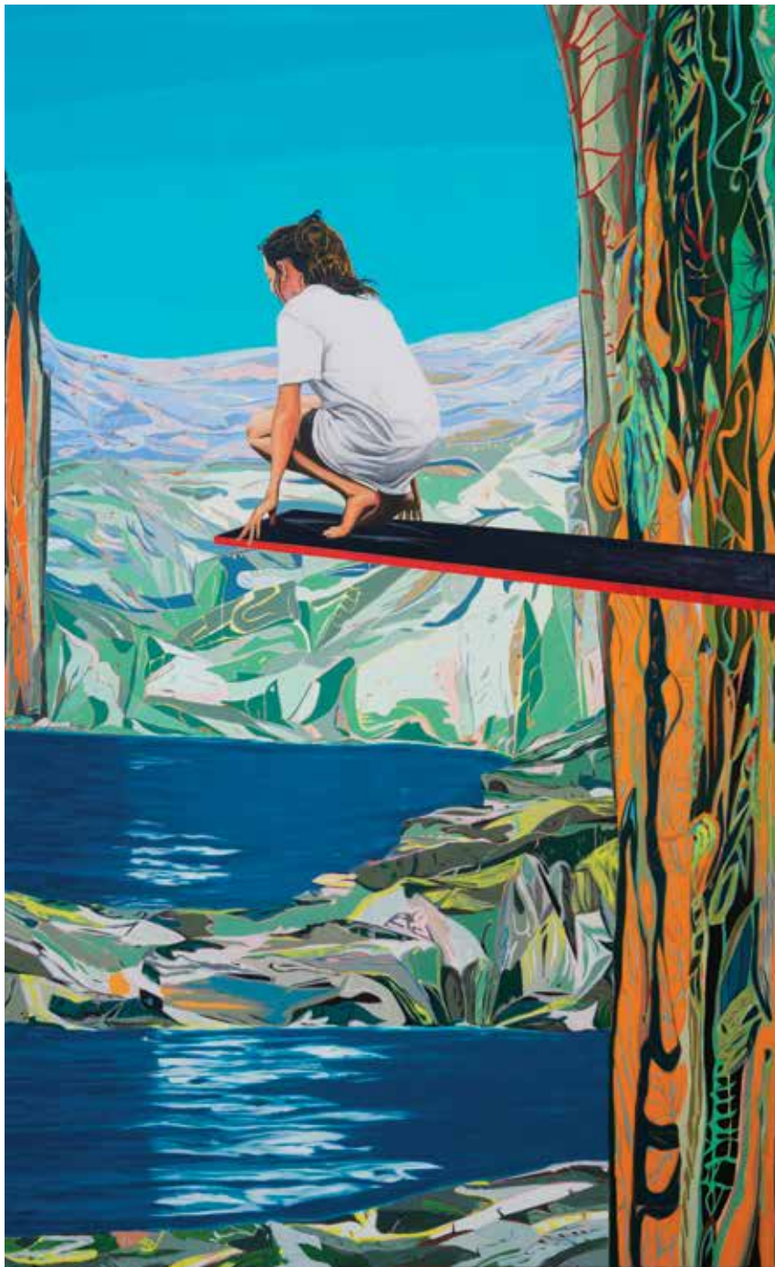
על קצות אצבעותייך, 2023, שמן על בד, 200/125 ס"מ