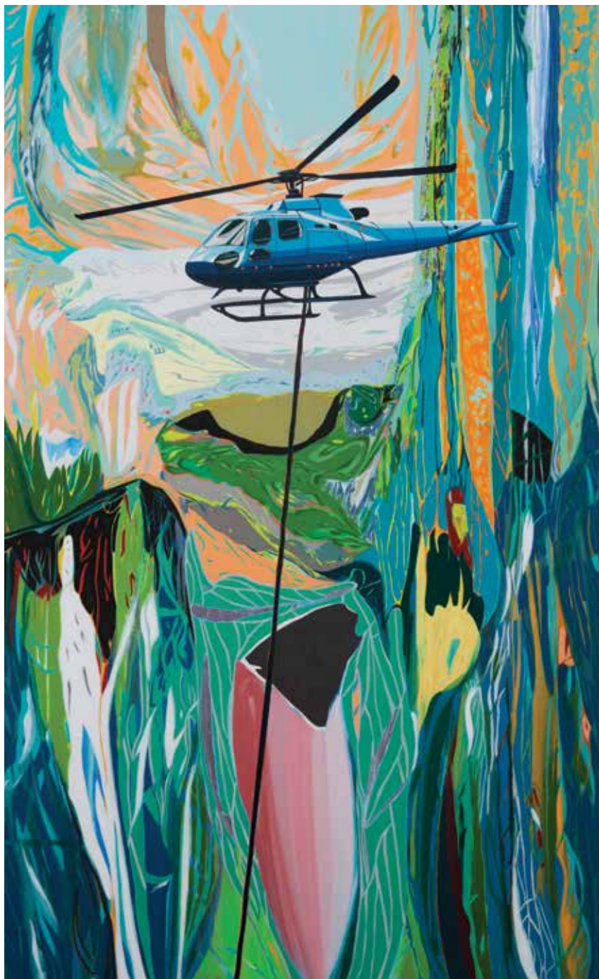
שיר ארץ, 2023, שמן על בד, 200/125 ס"מ