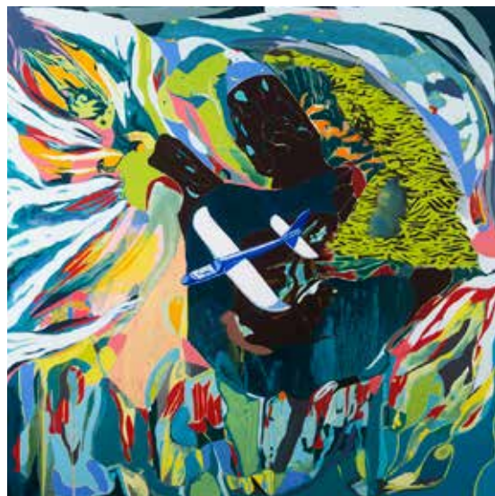
מתוס ללא טייס, 2020, שמן על בד, 150/150 ס"מ